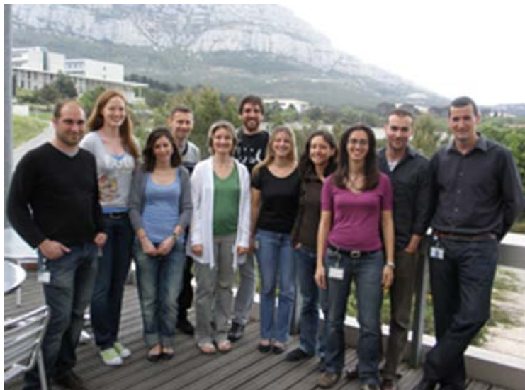
Equipe Toby Lawrence, Centre d'Immunologie Marseille Luminy

Jeg lærte enormt mye av teori og metoder, - både nye metoder og alternative løsninger og anvendelsesområder av metoder jeg kjente godt fra før. Samtidig var jeg faktisk en av de som kunne mest om in vivo imaging av transgene mus, og kunne også overføre noen av mine erfaringer om det til de som jobbet med det på instituttet. Et annet viktig aspekt med å jobbe i utlandet er det å lære en annerledes