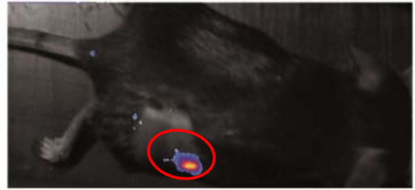
In vivo imaging av NF- \kappa B aktivitet i transgene mus indusert av voksende tumor

Mitt prosjekt bestod i å studere NF- \kappa B aktivitet i ulike kreftmodeller i transgene mus. I disse musene er NF- \kappa B aktiviteten er koblet til luciferase som avgir et lys som kan følges ved hjelp av et sensitivt kamera (se bilde). Videre så jeg på hvilke celler i tumoren som bidro til denne NF- \kappa B aktiviteten. For å sørge for at jeg aldri kjedet meg eller hadde lite å gjøre på lab'en, så hadde jeg også et sideprosjekt ved CIML som bestod i å lage reporter konstrukter for et par andre transkripsjonsfaktorer som er involvert i immunrespons mot kreft. Disse skulle brukes i beinmargstransplantasjon av mus for å teste aktiveringen av disse transkripsjonsfaktorene opp mot hverandre i tumorbærende mus.